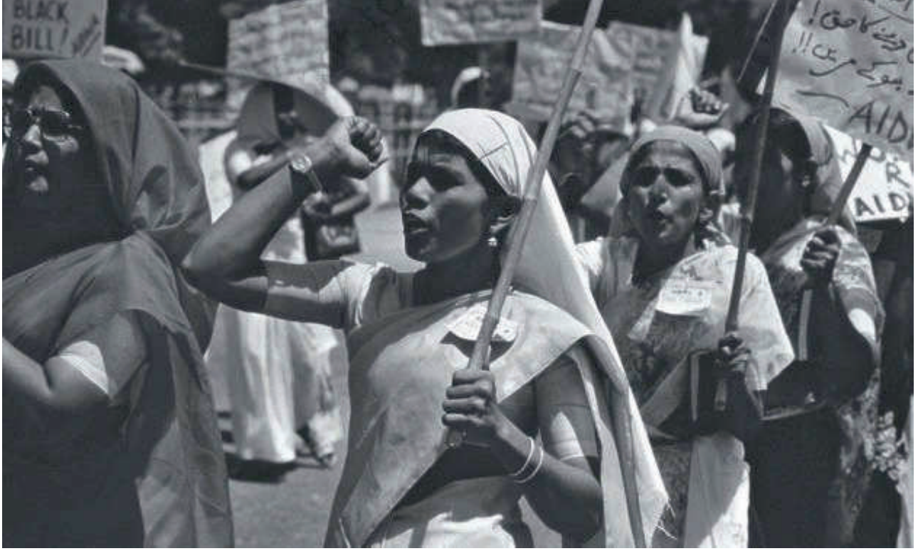
ಮಹಿಳೆಯರು ಜಗತ್ತನ್ನು ಬದಲಾಯಿಸುತ್ತಾರೆ, ಎಸ್‌ಪಿಎಲ್ !! ಎನ್‌ಸಿಇಆರ್‌ಟಿ, 2007

ಸರ್ಕಾರದ ನಾನಾ ಇಲಾಖೆಗಳ ಕಾರ್ಯ ನಿರ್ವಹಣೆಯಲ್ಲಿನ ದೋಷಗಳಿಂದಾಗಿ ನಾಗರಿಕರು ಶಾಸನಾತ್ಮಕ ಹಕ್ಕುಗಳನ್ನು ಕಳೆದುಕೊಂಡಿರುವ ಹಲವು ಪ್ರಕರಣಗಳನ್ನು ಎಸ್‌ಪಿಎಲ್