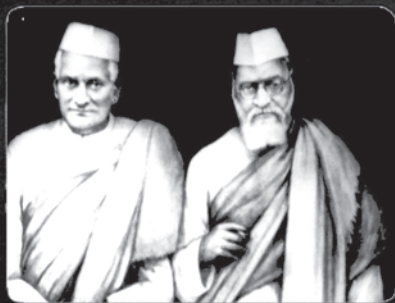
नेहरू मेमोरियल म्यूजियम एवं लाइब्रेरी, नई दिल्ली