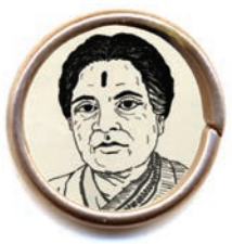
जी. दुर्गाबाई देशमुख (1909-1981), जन्म: आंध्र प्रदेश। वकील और महिला मुक्ति कार्यकर्ता। आंध्र महिला सभा की संस्थापक। कांग्रेस की सक्रिय नेता। बाद में: केंद्रीय समाज कल्याण बोर्ड की संस्थापक अध्यक्ष।