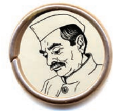
राजेंद्र प्रसाद (1884-1963), जन्म: बिहार। संविधान सभा के अध्यक्ष। वकील और चंपारण सत्याग्रह के प्रमुख भागीदार। तीन बार कांग्रेस अध्यक्ष। बाद में: भारत के प्रथम राष्ट्रपति।