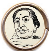
सरोजिनी नायडू (1879-1949) जन्म: आंध्र प्रदेश। कवयित्री, लेखिका और राजनैतिक कार्यकर्ता। कांग्रेस की अग्रणी महिला नेता। बाद में: उत्तर प्रदेश की राज्यपाल