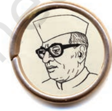
कन्हैयालाल माणिकलाल मुंशी

(1901-1961), जन्म: हरियाणा। सफल उद्यमी और पंजाब विधानसभा में पंथक अकाली पार्टी के नेता। संविधान सभा में कांग्रेस द्वारा मनोनीत। बाद में: केंद्रीय मंत्रिमंडल में रक्षा मंत्री।