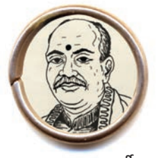
श्यामा प्रसाद मुखर्जी

(1887-1971), जन्म: गुजरात। वकील, इतिहासकार और भाषाविद्। कांग्रेसी नेता और गांधीवादी। बाद में: केंद्रीय मंत्रिमंडल में मंत्री। स्वतंत्र पार्टी के संस्थापक।