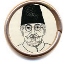
अबुल कलाम आज़ाद (1888-1958), जन्म: सऊदी अरब। शिक्षाविद्, लेखक और धर्मशास्त्रों के ज्ञाता; अरबी के विद्वान। कांग्रेसी नेता, राष्ट्रीय आंदोलन में अग्रणी भूमिका। मुस्लिम अलगाववादी राजनीति के विरोधी। बाद में: पहले केंद्रीय मंत्रिमंडल में शिक्षा मंत्री।

चुने गए जनप्रतिनिधियों की जो सभा संविधान नामक विशाल दस्तावेज़ को लिखने का काम करती है उसे संविधान सभा कहते हैं। भारतीय संविधान सभा के लिए जुलाई 1946 में चुनाव हुए थे। संविधान सभा की पहली बैठक दिसंबर 1946 को हुई थी। इसके तत्काल बाद देश दो हिस्सों-भारत और पाकिस्तान-में बँट गया। संविधान सभा भी दो हिस्सों में बँट गई- भारत की संविधान सभा और पाकिस्तान की