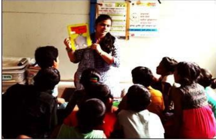
ಚಿತ್ರ 3. ಶಿಕ್ಷಕಿಯವರು ತನ್ನ ತರಗತಿಯಲ್ಲಿ ಗಟ್ಟಿಯಾಗಿ ಓದುತ್ತಿರುವುದು, ಮುಂಬೈ ಮೊಬೈಲ್ ಕ್ರೀಚ್, ಮುಂಬೈ.