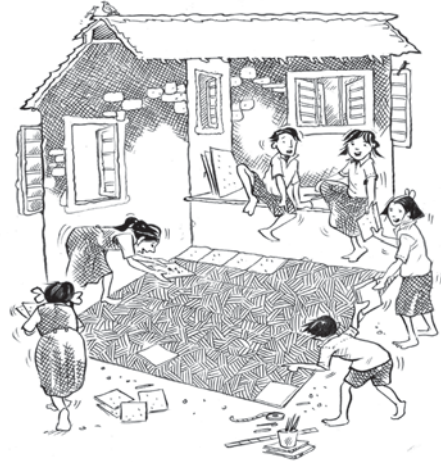
चित्र : प्रशान्त सोनी

प्रश्न 2. एक कमरे के फ़र्श में एक-एक वर्ग फुट के 120 टाइल्स लगाने पर पूरा फ़र्श ढँक जाता है। कमरे के फ़र्श का क्षेत्रफल कितना होगा?