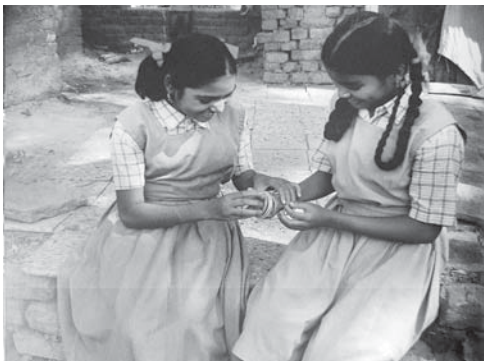
चित्र : 'स्कूल के दोस्त' कहानी से

कहानी एक सपने की तरह खुलती है जहाँ दो होनहार बालिकाएँ गाँव में प्राथमिक शिक्षा पूरी