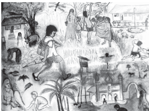
चित्र : 'पाठ्यपुस्तक' कहानी से

स्कूल के पहले दिन के लिए बच्चे के मन में तरोताज़ा उमंगों के जो रंग हैं, धीरे-धीरे उनपर एक अवसाद भरी धूल छाने लगती है। उमंग के रंग दबते चले जाते हैं।