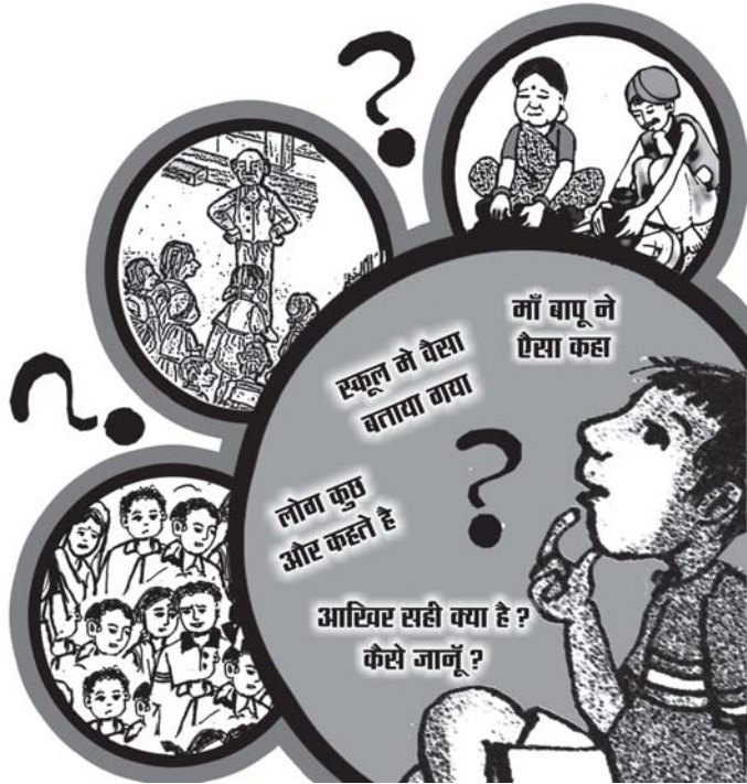
चित्र : शिवेन्द्र पांडिया

को भी इस वर्ग में रख रहे हैं। इन विषयों में मत भिन्नता का स्रोत परिवार, समुदाय और मीडिया हैं। इन परिवेशों में 'स्वीकृत मत' के अतिरिक्त जिन विचारों की उपस्थिति होती है वे ही किसी मुद्दे को विवादास्पद बनाते हैं। इसी क्रम में जब शिक्षकों से पूछा गया कि क्या ये विवादास्पद मुद्दे कक्षा के लिए महत्वपूर्ण हैं? तो सभी शिक्षकों ने इसकी स्वीकृति दी और अपने मत के पक्ष में बताया कि ये मुद्दे विद्यार्थियों को विचार करने की क्षमता और अवसर देते हैं। शिक्षकों का मानना था कि जब कक्षा में इन विषयों पर बातचीत होती है तो बच्चे खुद भी विचार करते हैं और कई बार वे नए अनुभवों को चर्चा में जोड़ते भी हैं। शिक्षकों ने 'ज्ञान में वृद्धि' के लिए कक्षा में एक से अधिक मत वाले मुद्दे के समावेश को उपयोगी बताया। इसके समर्थन में उनके तर्क थे, 'हर चर्चा उन्हें लाभ पहुँचाती है। ज़रूरी नहीं है कि किताब में दिए विषय पर बातें करें। वे आपस में भी बातचीत कर सीखते हैं।'