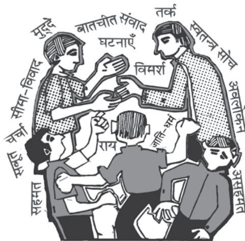
चित्र : शिवेन्द्र पांडिया

बनाने की दिशा में शिक्षा कैसे प्रभावी बने। इसकी एक सम्भावना हमारे स्कूल हो सकते हैं। जहाँ इन विषयों को आलोचनात्मक नज़रिए से देखा जाए, जहाँ वैधता की कसौटियों से बच्चों को परिचित कराया जाए, जहाँ वाद-विवाद के साथ दूसरों की सराहना और स्वीकृति के भी मूल्य हों। क्या हमारे स्कूलों में ऐसा होता है? इस स्थिति का मुआयना करने के लिए मैंने कुछ सामाजिक विज्ञान शिक्षकों से बातचीत की। उस बातचीत के ब्यौरा को यहाँ प्रस्तुत किया जा रहा है।