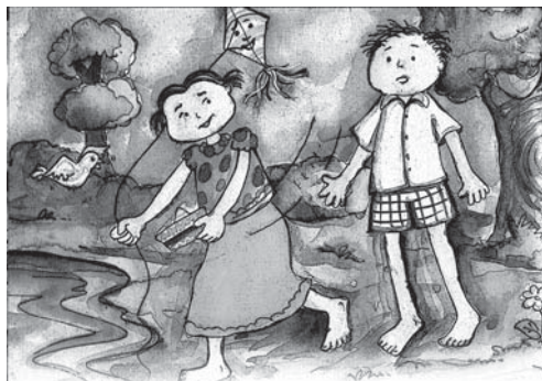
चित्र : 4

बच्चों के साथ इस तरह कविता पर काम करने का यह मेरा पहला अनुभव था। कविता पर काम करते हुए मुझे महसूस हुआ कि अगर कविता बच्चों की रुचि व स्तर के अनुसार हो और उसमें गेयता हो तो वे जल्दी ही उसको गाना सीख जाते हैं। यह सीखना उनके उस कविता को पढ़ने और लिखने को सरल बनाता है, क्योंकि बच्चे अर्थ से जुड़ पाते हैं। मैंने पहले भी बच्चों के साथ कविताएँ की हैं लेकिन वह मुझे ही रूखी लगती थीं। मसलन, यह कविताएँ देखें :