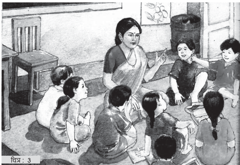
चित्र : 3

आज कविता की पहली दो पंक्तियों को लिखने का काम किया। मैंने बोर्ड पर कविता की पंक्तियों को लिखा और हर शब्द पर अंगुली रखते हुए उन्हें पढ़ा। उसके बाद बच्चों से लिखने को कहा। जब बच्चे लिख रहे थे, वे शब्दों को बोल भी पा रहे थे क्योंकि उन्हें कविता याद थी। हालाँकि वे शब्द बहुत सुन्दर बना रहे हों ऐसा नहीं था, लेकिन लिखने की कोशिश कर रहे थे और शब्दों को पहचानने की भी। मसलन, सर शब्द बच्चों ने पकड़ लिया था, फर और पतंग भी। चौथे दिन इतना ही काम हुआ लेकिन मुझे इस बात का सन्तोष था कि सभी बच्चों ने लिखने का काम किया और कुछ शब्दों को पहचानने का भी। इसके बाद तुकान्त शब्दों पर बात कर उनके साथ काम किया। कविता में आए तुकान्त शब्दों मसलन, सर-सर, फर-फर,