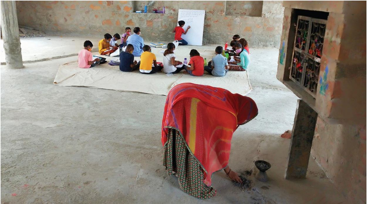
ಸಮುದಾಯ ಶಾಲೆಯಾಗಿ ದೇವಸ್ಥಾನದ ಬಳಕೆ