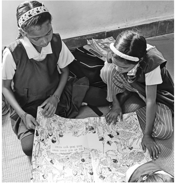
चित्र : हिमांशु खोले

एकलव्य के प्राथमिक शिक्षा कार्यक्रम में पाठ्यक्रम का एक बुनियादी कौशल था— सुनकर समझना और बोलकर अभिव्यक्त करना। इनमें पहला कौशल, सुनकर समझना क्या है? हमारे आसपास सुनकर समझने के लिए बहुत कुछ होता है। बातचीत, आदेश, निर्देश, विनती,