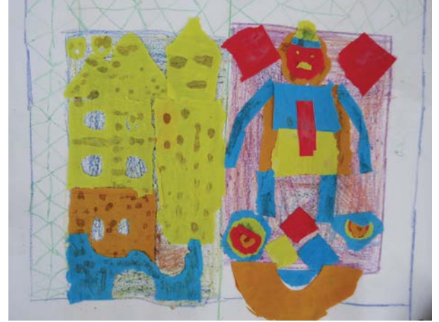
Collage on paper by Class 6 students, 2017

'ಅದು ನಿಮ್ಮ ಬದುಕಿಗೆ ಹೇಗೆ ಸಹಾಯ ಮಾಡುತ್ತದೆ?' ಎಂದು ಕೇಳಿದೆ.