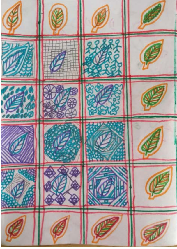
Leaf drawing and patterning exercise with pencil and sketchpens on paper by a Class 5 student, 2017

ಉಮೇದಿನಿಂದ ಇನ್ನಷ್ಟು ಮಕ್ಕಳು ತಮ್ಮ ಕೆಲಸವನ್ನು ಬೇಗನೆ ಮುಗಿಸಿದರು! ರಚನಾತ್ಮಕ ವಾತಾವರಣವನ್ನು ಒಡೆದು ಹೊರಬಂದು, ಆಟವಾಡುವ, ಕಲ್ಪನೆ ಮತ್ತು ಸೃಜನಶೀಲತೆಯನ್ನು ಪೋಷಿಸುವ ಅಪಾಯವನ್ನು ತೆಗೆದುಕೊಳ್ಳುವ ಪ್ರವೃತ್ತಿ ಇದಾಗಿದೆ.