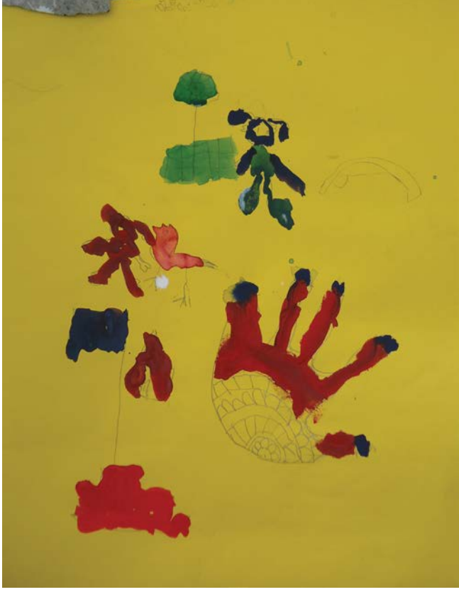
Watercolour on paper by a Class 2 student, 2017