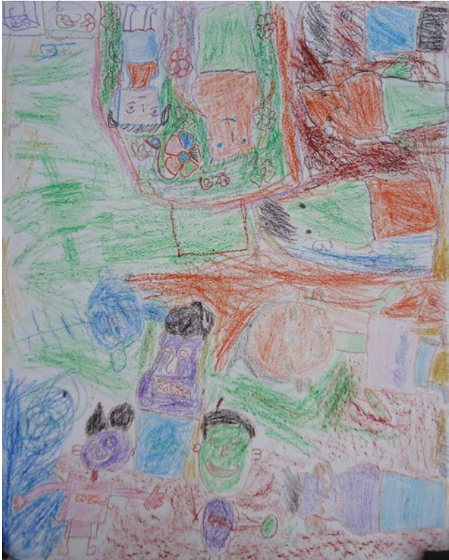
Group work by Class 3, 2017