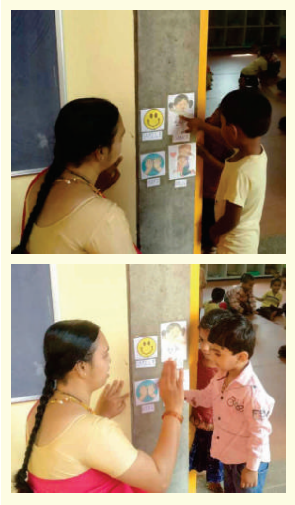
ಚಿತ್ರ 3. ತರಗತಿಯನ್ನು ಪ್ರವೇಶಿಸುತ್ತಿರುವ ಮಗುವನ್ನು ಋಷಿಯಿಂದ ಬರಮಾಡಿಕೊಳ್ಳುತ್ತಿರುವ ಶಿಕ್ಷಕಿ.