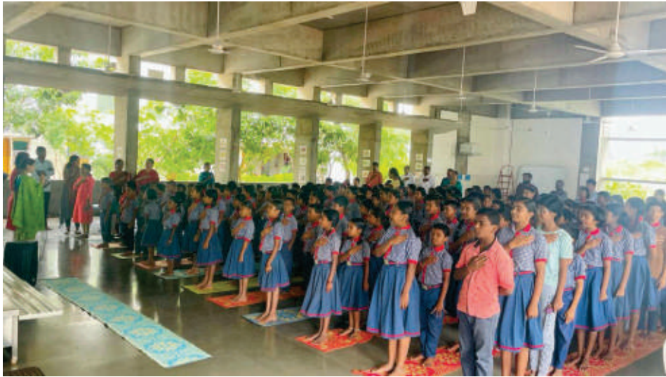
ಚಿತ್ರ 2. ತಮ್ಮ ಸುತ್ತಲಿರುವ ಪ್ರತಿಯೊಬ್ಬರನ್ನು ಮತ್ತು ಎಲ್ಲವುಗಳನ್ನು ಗೌರವಿಸುತ್ತೇವೆ ಎಂದು ಬೆಳಗಿನ ಸಮಯದಲ್ಲಿ ಶಿಕ್ಷಕರು ಮತ್ತು ವಿದ್ಯಾರ್ಥಿಗಳು ಒಟ್ಟಾಗಿಯೇ ಪ್ರತಿಜ್ಞೆಯನ್ನು ಸ್ವೀಕರಿಸುತ್ತಿರುವುದು (ಪ್ರಮಾಣ ಮಾಡುತ್ತಿರುವುದು).