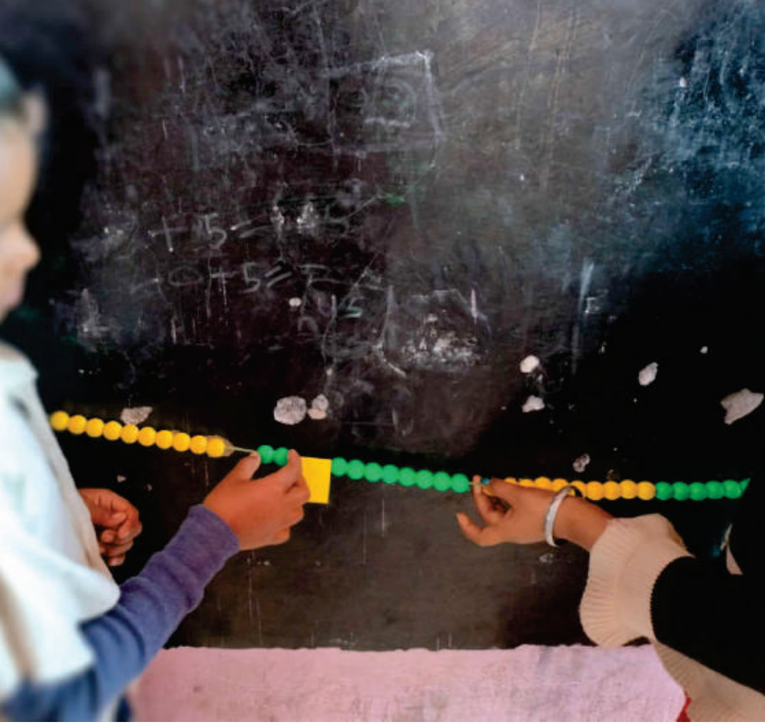
ಚಿತ್ರ 3. ಗಣಿತಮಾಲ ಮತ್ತು ಚಿಟ್ಟೆಯ ಸಾಧನದೊಂದಿಗೆ ಮಕ್ಕಳು ಆಟವಾಡುತ್ತಿರುವುದು.