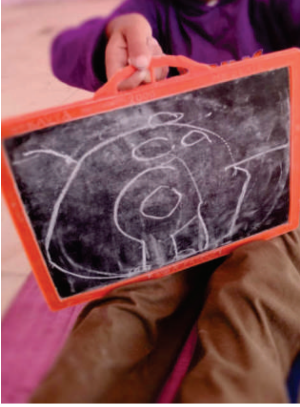
ಚಿತ್ರ 2. ಹರಿ ಓಂ ಬಿಡಿಸಿದ ನನ್ನ ಅಂದರೆ 'ಕುಳ್ಳಿ ಟೀಚರ್'ನ ಚಿತ್ರ