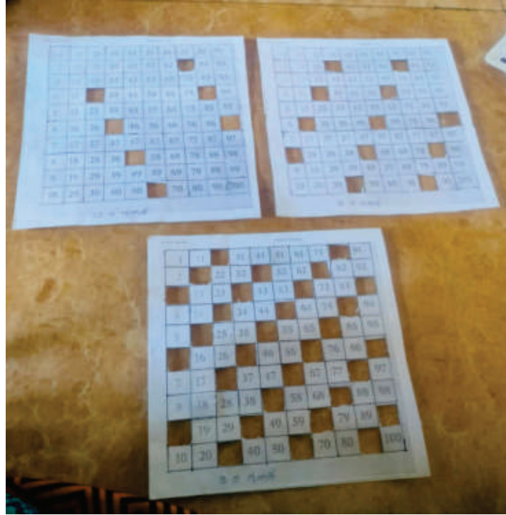
ಚಿತ್ರ 3. 1-100 ಸಂಖ್ಯೆಯ ಚಾರ್ಟ್‌ಗಳಲ್ಲಿ 3,8 ಮತ್ತು 12 ಸಂಖ್ಯೆಯ ಗುಣಕಗಳನ್ನು ಗುರುತಿಸುವುದು