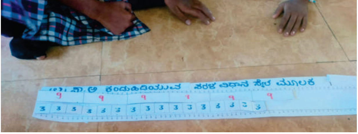
ಚಿತ್ರ 2. ಸ್ವಲ್ಪ ಅಥವಾ ಸಂಖ್ಯೆಯ ರೇಖೆಯನ್ನು ಬಳಸಿಕೊಂಡು ಎರಡು ಸಂಖ್ಯೆಗಳ ಲಸಾಅ (LCM)ವನ್ನು ಕಂಡುಹಿಡಿಯುವುದು