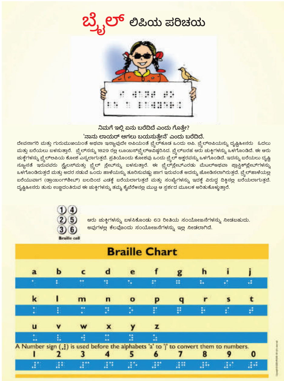
ಚಿತ್ರ 1. ಬ್ರೈಲ್ ಲಿಪಿಯನ್ನು ಅರ್ಥಮಾಡಿಕೊಳ್ಳುವುದು, ಒಂದು ಬೋಧನಾ ಸಾಧನ