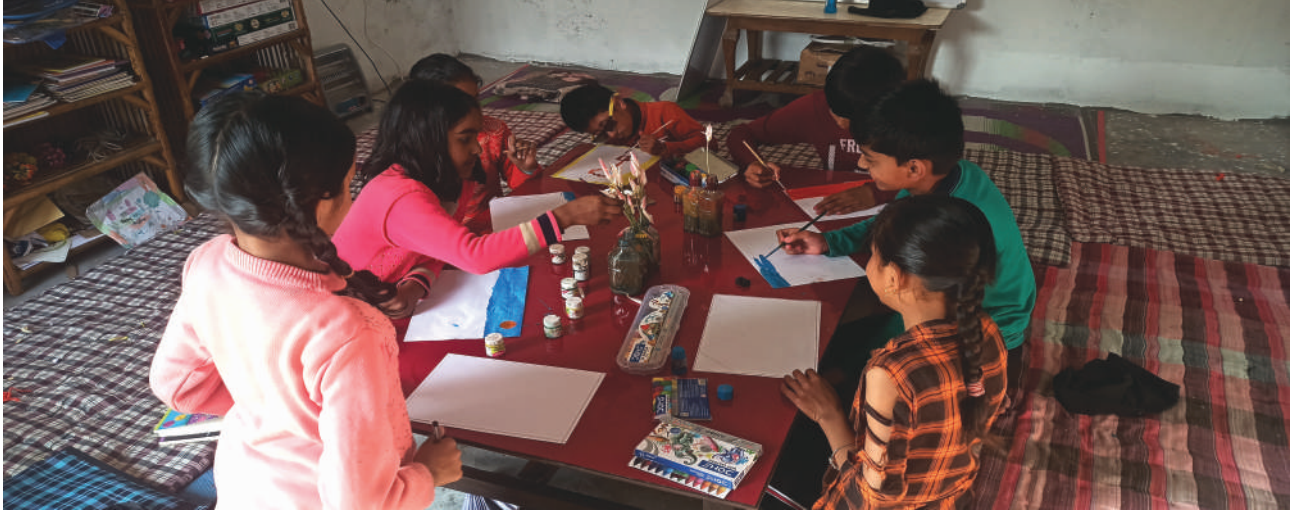
ಚಿತ್ರ 1: ಚಂಪಾವತ್‌ನ ರಂಗಕಾರ್‌ವಾನ್ ಕಲಿಕಾ ಕೇಂದ್ರದ ಅವಧಿಯಲ್ಲಿ ಮಕ್ಕಳು ಬಣ್ಣಗಳೊಂದಿಗೆ ಆಟವಾಡುತ್ತಿರುವುದು.

ಕಿರುಚೆಲು ಅಪೇಕ್ಷಿಸಿದ್ದೆ ವಿದ್ಯಾರ್ಥಿಯ ಮೇಲೆ ಈ ಅವಧಿಯು ಹೇಗೆ ಪರಿಣಾಮ ಬೀರಿತು? ಅವನು ಸಿಂಡರಿಸಿದ ಮುಖವನ್ನು ಚಿತ್ರಿಸಿ ತನ್ನ ಕೋಪವನ್ನು ವ್ಯಕ್ತಪಡಿಸಿ, ಅದುವೇ ತನ್ನ ರಾಕ್ಷಸ ಎಂದನು. ಅದನ್ನು ಚಿತ್ರಿಸಲು ಅವನು ಆರಿಸಿದ ಬಣ್ಣಗಳು, ತನ್ನ ಭಾವನೆಯ ಬಗ್ಗೆ ಅವನಿಗಿದ್ದ ಅರಿವು, ಉಪಶಮನಗೊಳ್ಳುವಿಕೆಯ ಮೊದಲ ಹೆಜ್ಜೆಯಾಗಿತ್ತು. ಬಣ್ಣ ಬಳಯುವ ಮತ್ತು ಅಭಿವ್ಯಕ್ತಪಡಿಸುವ ಪರಿಹಾರವನ್ನು ಅವನು ಕಂಡುಕೊಂಡ.