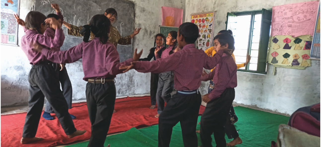
ಚಿತ್ರ 2: ಚಂಪಾವತ್‌ನ ಸಿಮಾಲ್ವಾ ಎಂಬಲ್ಲಿನ ಸರ್ಕಾರಿ ಪ್ರಾಥಮಿಕ ಶಾಲೆಯಲ್ಲಿ ಮಕ್ಕಳು ಮತ್ತು ಸುಗಮಕಾರರು ದೈಹಿಕ ಚಲನೆಗಳೊಂದಿಗೆ ಅರಾಮದಾಯಕವಾಗಲು ಆಟದ ಮೂಲಕ ಸಜ್ಜುಗೊಳ್ಳುತ್ತಿರುವುದು.