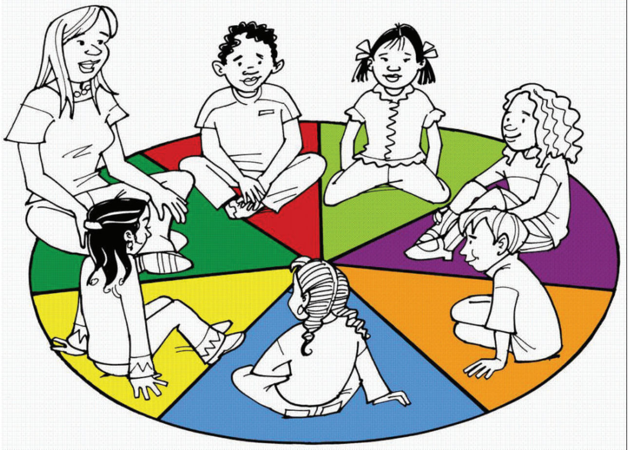
ಚಿತ್ರ 2. ಸಂವಾದಾತ್ಮಕ ವೃತ್ತದ ಕಾಲ್ಪನಿಕ ಮೂಲ ಚಿತ್ರಣ

ಪ್ರಾಥಮಿಕ ತರಗತಿಯ ಮಕ್ಕಳ ವಯಸ್ಸು ಕೂಡಾ, ಸುಗಮಕಾರರು ಬಳಸಬಹುದಾದ ತೃತೀಯ ಅಂಶಗಳನ್ನು ನಿರ್ಣಯಿಸುತ್ತವೆ. ಅಂತಹ ಕೆಲವು ಮಾದರಿಗಳನ್ನು ಇಲ್ಲಿ ಉಲ್ಲೇಖಿಸಲಾಗಿದೆ.