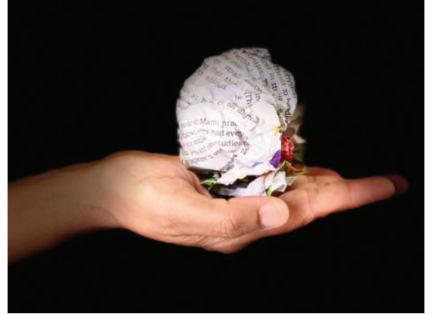
ಚಿತ್ರ 2. ಕಥೆಯ ಉಂಡೆ

ಫಲಿತಾಂಶ: ತಮ್ಮ ಓದುವ ಕೌಶಲವನ್ನು ಸುಧಾರಿಸಿಕೊಂಡು ಒಂದು ಕಥೆಯನ್ನು ಊಹಿಸುವುದನ್ನು ಮತ್ತು ಅರ್ಥ ಮಾಡಿಕೊಳ್ಳುವುದನ್ನು ವಿದ್ಯಾರ್ಥಿಗಳು ಕಲಿತುಕೊಳ್ಳುತ್ತಾರೆ.