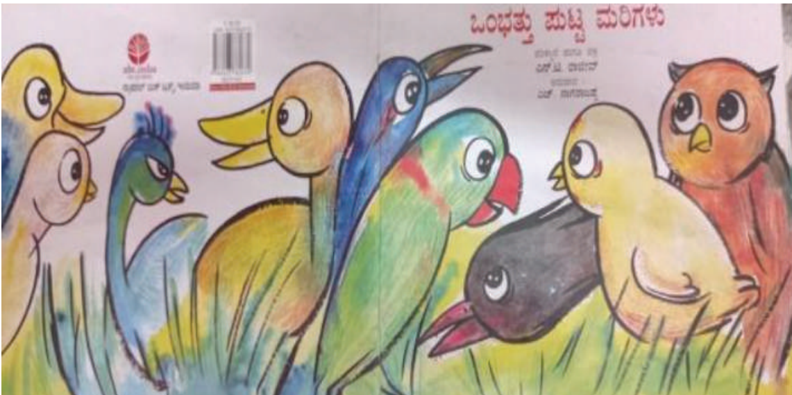
ಚಿತ್ರ 3. ಒಂಭತ್ತು ಪುಟ್ಟ ಮರಿಗಳು ಕಥೆಯಿಂದ ಒಂದು ಸಚಿತ್ರ ವಿವರಣೆ

'ಮಾಂತ್ರಿಕ ತುಂಡು' ಎಂಬ ಪ್ರಥಮ ಪ್ರಕಾಶನದ ಕಥೆಯನ್ನು ಬಳಸಿಕೊಂಡು ಮಕ್ಕಳಿಗೆ ಅಯಸ್ಕಾಂತತೆಯನ್ನು ಪರಿಚಯಿಸಿದೆವು. ಚಿಕ್ಕ ಹುಡುಗಿಯೊಬ್ಬಳು ತನ್ನ ಅಣ್ಣನ ಕೊಠಡಿಯಲ್ಲಿ ಸಿಕ್ಕಿದ ಅಯಸ್ಕಾಂತದ ಮೂಲಕ ಅದು ಯಾವ ವಸ್ತುವಿಗೆ ಅಂಟಿಕೊಳ್ಳುತ್ತದೆ ಮತ್ತು ಯಾವ ವಸ್ತುವಿಗೆ