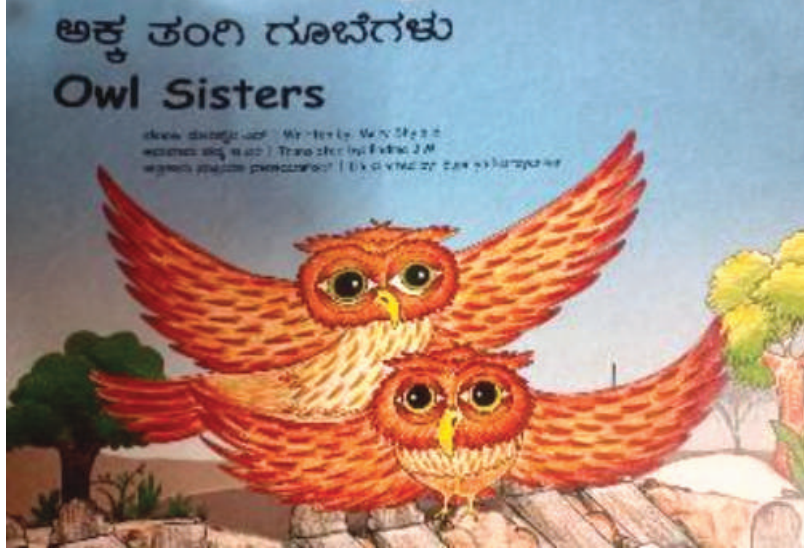
ಚಿತ್ರ 2. ಅಕ್ಕ ತಂಗಿ ಗೂಬೆಗಳು, ಕಾರ್ಯಾಗಾರದ ಸಮಯದಲ್ಲಿ ರಚಿಸಿದ ಮತ್ತು ವಿವರಿಸಿದ ಕಥೆಗಳಲ್ಲಿ ಇದು ಒಂದು

ಕೆಲವು ಕಥೆಗಳು ಮಕ್ಕಳಿಗೆ ಸಂಬಂಧಿಸಬಹುದಾದ ಕಥೆಗಳಾಗಿದ್ದವು. ಉದಾಹರಣೆಗೆ, ನಮ್ಮ ಶಿಕ್ಷಕರೊಬ್ಬರು ಬರೆದ ಕಥೆಯಾದ ಅಕ್ಕ ತಂಗಿ ಗೂಬೆಗಳು ಈ ಕಥೆಯನ್ನು ನಾವು ಚಿತ್ರ ಸಮೇತವಾಗಿ ದ್ವಿಭಾಷಾ ಪುಸ್ತಕವಾಗಿ ಪ್ರಕಟಿಸಿದೆವು. ಈ ಪುಸ್ತಕದಲ್ಲಿ ಇತರ ಕಥೆಗಳೂ ಇದ್ದವು: ಹುಣಸೆ ಪೆಪ್ಪರ್ ಮೆಂಟ್: ಹುಣಸೆ ಪೆಪ್ಪರ್ ಮೆಂಟ್ ತಯಾರಿಸುವಾಗ ಇಬ್ಬರು ಸಹೋದರಿಯರು ಇಕ್ಕಟ್ಟಿಗೆ ಸಿಲುಕುವ ಕಥೆ; ಮತ್ತು ಪುಟ್ಟಯ ಪ್ರಶ್ನೆಗಳು: ತನ್ನ ಅಜ್ಜಿಯ ಹಳ್ಳಿಗೆ ಭೇಟಿ ನೀಡಿದಾಗ ದಾರಿಯಲ್ಲಿ ಬರುವ ಎಲ್ಲವನ್ನೂ ಪ್ರಶ್ನಿಸುವ ಪುಟ್ಟ ಎಂಬ ಪುಟ್ಟ ಹುಡುಗಿಯ ಕಥೆ; ಮರ ರಾಕ್ಷಸ: ಇದು ಮರವನ್ನು ಕಡಿಯಲು ಬಂದಿದ್ದ ಮರಕಡಿಯುವವನ ಮನೆಗೆ ಹಬ್ಬದೂಟಕ್ಕೆ ಬರುವ ರಾಕ್ಷಸನ ಕುರಿತಾದ ಕಥೆಯಾಗಿತ್ತು.