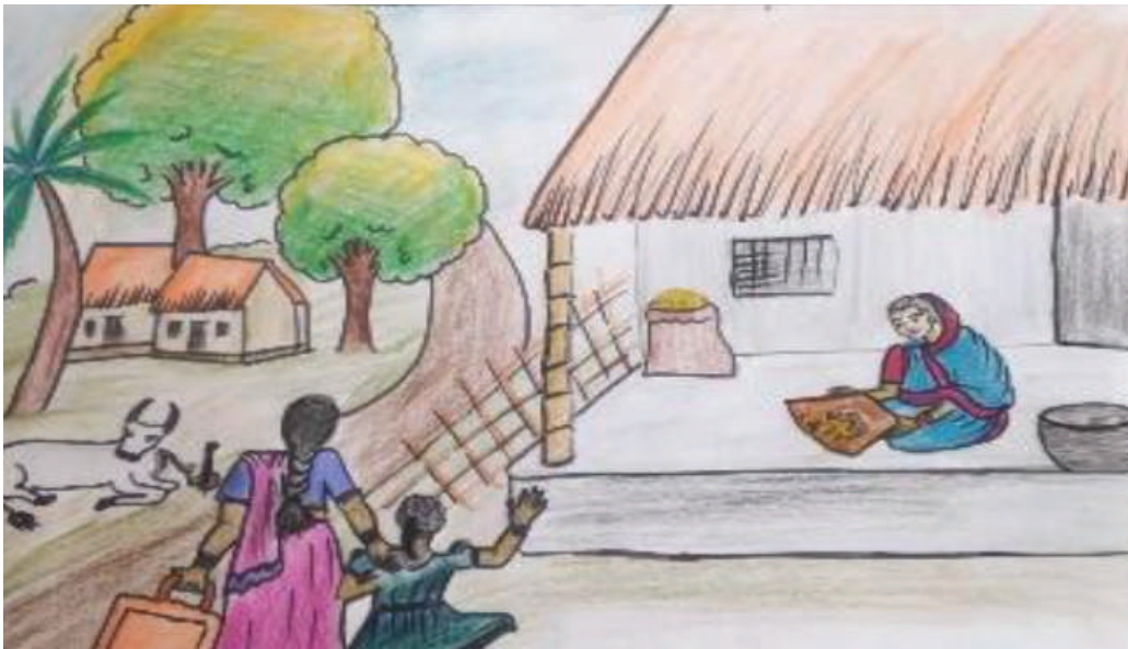
ಚಿತ್ರ 1. ಪುಟ್ಟಿಯ ಪ್ರಶ್ನೆಗಳು, ಕಾರ್ಯಾಗಾರದ ಸಮಯದಲ್ಲಿ ರಚಿಸಿದ ಮತ್ತು ವಿವರಿಸಿದ ಕಥೆಗಳಲ್ಲಿ ಇದು ಒಂದು

ಕರ್ನಾಟಕದ ನಾನಾ ಪ್ರದೇಶಗಳ ಆಡುಭಾಷೆ, ಆಚಾರ-ವಿಚಾರ, ಪರಿಸರ ವಿಭಿನ್ನವಾಗಿರುವುದರಿಂದ ಎಲ್ಲ ಪ್ರದೇಶಗಳ ಶಿಕ್ಷಕರನ್ನು ಒಂದೇ ಸೂರಿನಡಿ ತಂದು ಕಥೆಗಳನ್ನು ರಚಿಸಲು ನಿರ್ಧರಿಸಲಾಯಿತು. ಕಾರ್ಯಾಗಾರಕ್ಕೆ ಮೊದಲು, ನಾವು ಮಕ್ಕಳ ಸಾಹಿತ್ಯದಿಂದ ಹಲವಾರು ಅನುವಾದಿತ, ಸಚಿತ್ರ ಕಥೆಗಳನ್ನು ಓದಿ ವಿಷಯದ ಆಧಾರದ ಮೇಲೆ ಅವುಗಳನ್ನು ವಿಂಗಡಿಸಿಕೊಂಡೆವು. ಕಥೆಗಳ ಕೇಂದ್ರ ವಿಷಯ ಮತ್ತು ಅವುಗಳಲ್ಲಿ ಅಂತರ್ಗತವಾಗಿರುವ ಕಲಿಕೆಗಳನ್ನು ಸಹ ಚರ್ಚಿಸಿದೆವು.