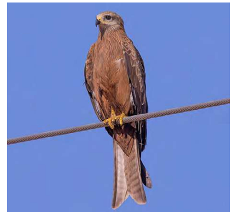
ಚಿತ್ರ 1: ಕಪ್ಪುಹದ್ದು (ಮಿಲ್ವಸ್ ಪೈಗ್ರಾನ್ಸ್) ವಿದ್ಯಾರ್ಥಿಗಳನ್ನು ಕೇಳಿ: ನೀವು ಈ ಹಕ್ಕಿಯನ್ನು ನಿಮ್ಮ ನೆರೆಹೊರೆಯಲ್ಲಿ ನೋಡಿದ್ದೀರಾ? ಇದರ ಬಗ್ಗೆ ನಿಮಗೆ ಏನು ತಿಳಿದಿದೆ? ನೀವು ಅದರ ವಿಭಿನ್ನ ದೈಹಿಕ ಲಕ್ಷಣಗಳನ್ನು ಹೇಗೆ ವಿವರಿಸುವಿರಿ? ಉದಾಹರಣೆಗೆ: ಗಾತ್ರ, ಕೊಪ್ಪು, ಉಗುರು ಮತ್ತು ಬಣ್ಣ. ಆಹಾರದ ಜಾಲದಲ್ಲಿ ಈ ಪಕ್ಷಿಗಳು ಯಾವ ಪಾತ್ರವನ್ನು ವಹಿಸುತ್ತವೆ?

ಜೀವರಕ್ಷಕ ಪ್ರಯತ್ನಗಳ ಒಂದು ಸಶಕ್ತವಾದ ಮತ್ತು ಸೂಕ್ಷ್ಮವಾದ ಚಿತ್ರಣವಾಗಿದೆ (ನೋಡಿ: ಚಿತ್ರ 2). ಈ