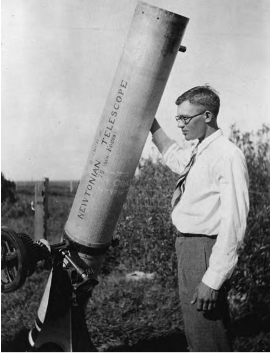
ಚಿತ್ರ 2. ಮನೆಯಲ್ಲೇ ನಿರ್ಮಿಸಿದ ತಮ್ಮ 9 ಇಂಚಿನ ದೂರದರ್ಶಕದೊಂದಿಗೆ ಕ್ಲೈಡ್ ಟೋಂಬಾ. ಅದರಲ್ಲಿ ಬಳಸಿದ ಕನ್ನಡಿಗಳನ್ನು ಟೋಂಬಾ ತಾವೇ ಸ್ವತಃ ಉಜ್ಜಿ ತಯಾರಿಸಿದ್ದರು. ತಮ್ಮ ತಂದೆಯ 1910ರ ಬ್ಯೂಯಿಕ್ ಕಾರಿನ ವಂಕದಂಡದ ಭಾಗವನ್ನು ಮತ್ತು ತಮ್ಮ ಜಮೀನಿನಲ್ಲಿ ಬಳಸಲಾಗುತ್ತಿದ್ದ ಒಂದು ಕ್ರೀಮು ಬೇರ್ಪಡಿಸುವ ಯಂತ್ರದ ತ್ಯಾಜ್ಯ ಭಾಗಗಳನ್ನು ಬಳಸಿಕೊಂಡು ದೂರದರ್ಶಕಕ್ಕಾಗಿ ತಮ್ಮದೇ ಸ್ವಂತ ಆಧಾರ ಪೀಠವನ್ನೂ ನಿರ್ಮಿಸಿದ್ದರು. ಗುರು ಮತ್ತು ಮಂಗಳ ಗ್ರಹಗಳ ಮೇಲ್ಮೈಗಳ ಮೇಲಿನ ಗುರುತುಗಳನ್ನು ಅವರು ವೀಕ್ಷಿಸಲು ಸಾಧ್ಯವಾಗುವಂತೆ ಮಾಡಿದ್ದು ಇದೇ ದೂರದರ್ಶಕ.