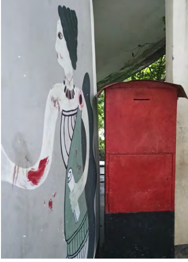
ಚಿತ್ರ 1. ಕಪಿಲಾ ಬೈದೇವ್ ಪೆಟ್ಟಿಗೆ. ಒಂದು ಸಾಮಾನ್ಯ ಅಂಚೆ ಪೆಟ್ಟಿಗೆಯಂತೆ ವಿನ್ಯಾಸಗೊಳಿಸಲಾದ ಈ ಪೆಟ್ಟಿಗೆಯಲ್ಲಿ ವಿದ್ಯಾರ್ಥಿಗಳು ತಮ್ಮ ಪ್ರಶ್ನೆಗಳನ್ನು ಹಾಕುತ್ತಾರೆ. ಕೃಪೆ: ದೀಪಕ್ ರಜಪೂತ್. ಪರವಾನಗಿ: CC BY-NC-ND.

ಭಾವನೆಯಾಗಲಿ - ಎಲ್ಲ ವಿಷಯಗಳ ಬಗ್ಗೆಯೂ ಅಪಾರ ಜ್ಞಾನ ಹೊಂದಿದ್ದಾಳೆ ಎಂದು ಮಕ್ಕಳಿಗೆ ತಿಳಿಸಿದೆವು. ವಿದ್ಯಾರ್ಥಿಗಳ ಪ್ರಶ್ನೆಗಳನ್ನು ಸ್ವೀಕರಿಸಲು ನಾವು ಸಾಂಪ್ರದಾಯಿಕ ಅಂಚೆ ಪೆಟ್ಟಿಗೆಯಂತಿರುವ ವಿಶೇಷವಾದ 'ಕಪಿಲಾ ಬೈದೇವ್ ಪೆಟ್ಟಿಗೆ'ಯನ್ನು ಸಿದ್ಧಪಡಿಸಿದೆವು. (ಚಿತ್ರ 1 ನೋಡಿ).