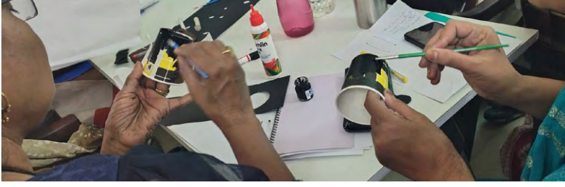
ಚಿತ್ರ 1. ಕೆಲವು ಶಿಕ್ಷಕರು ತಮ್ಮ ಪೇಪರ್ ಲೋಟಗಳ ಹೊರಮೈಯನ್ನು ಕಪ್ಪಾಗಿಸಲು ಪೋಸ್ಟರ್ ಬಣ್ಣವನ್ನು ಬಳಸಿದರು. ಕೃಪೆ: ಅಂಕಿತಾ ಚತುರ್ವೇದಿ. ಪರವಾನಗಿ: CC BY-NC-ND.

ತರಗತಿಯಲ್ಲಿ ನೀವು ಈ ಪರಿಕಲ್ಪನೆಯನ್ನು ಹೇಗೆ ವಿವರಿಸುತ್ತೀರಿ? ನೀವು ಈ ಮಾದರಿಯನ್ನು ತಯಾರಿಸಲು ಬಯಸುತ್ತೀರಾ? ಇದನ್ನು ತಯಾರಿಸಲು ನಿಮಗೆ ಯಾವ ಸಾಮಗ್ರಿಗಳು ಬೇಕಾಗುತ್ತವೆ? ತಮ್ಮದೇ ಆದ ಮಾದರಿಗಳನ್ನು ತಯಾರಿಸುವ ಕಲ್ಪನೆಯ ಬಗ್ಗೆ ಶಿಕ್ಷಕರು ತೋರಿದ ಉತ್ಸಾಹವನ್ನು ಕಂಡು, ನಾನು ಅವರು ಅದರ ಕೆಲಸವನ್ನು ಪ್ರಾರಂಭಿಸಬಹುದು ಎಂದು ಸೂಚಿಸಿದೆ. ಮಾದರಿ ತಯಾರಿಕೆಯ ಈ ಅಭ್ಯಾಸಕ್ಕಾಗಿ ನಾನು ಬಿಸಾಡಬಹುದಾದ ಲೋಟಗಳು, ಕಪ್ಪು ಮಾರ್ಕರ್ ಪೆನ್ನುಗಳು, ಬಟರ್ ಪೇಪರ್, ಅಂಟು ಮತ್ತು ಫೆವಿಕಾಲ್ ಟ್ಯೂಬ್‌ಗಳು, ಸೂಜಿಗಳು ಮತ್ತು ರಬ್ಬರ್ ಬ್ಯಾಂಡ್‌ಗಳಂತಹ ಸಾಮಗ್ರಿಗಳನ್ನು ನೀಡಿದೆ.