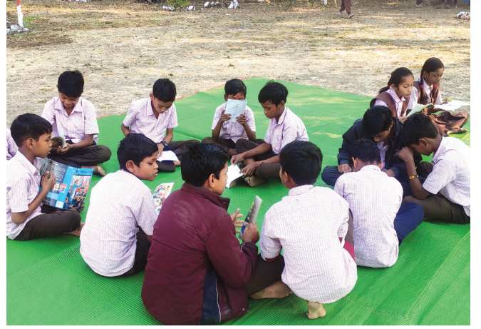
चित्र 2: छोटे समूह में पठन-पाठन और चर्चा-परिचर्चा

जब मैं कोई शब्द बोलता तो विद्यार्थियों को तेज़ी से सही गोले में कूदना होता, और उस शब्द को ज़ोर से पढ़ना होता था। कभी-कभी उनसे छोटे-छोटे समूह बनाने को कहता, तथा अपने समूह के भीतर बारी-बारी से शब्दों को बोलने और इस गतिविधि में नए शब्द जोड़ने को कहता। इस गतिविधि से कक्षा में काफ़ी उत्साह पैदा हो गया। खेल के दौरान विद्यार्थी बार-बार शब्दों को