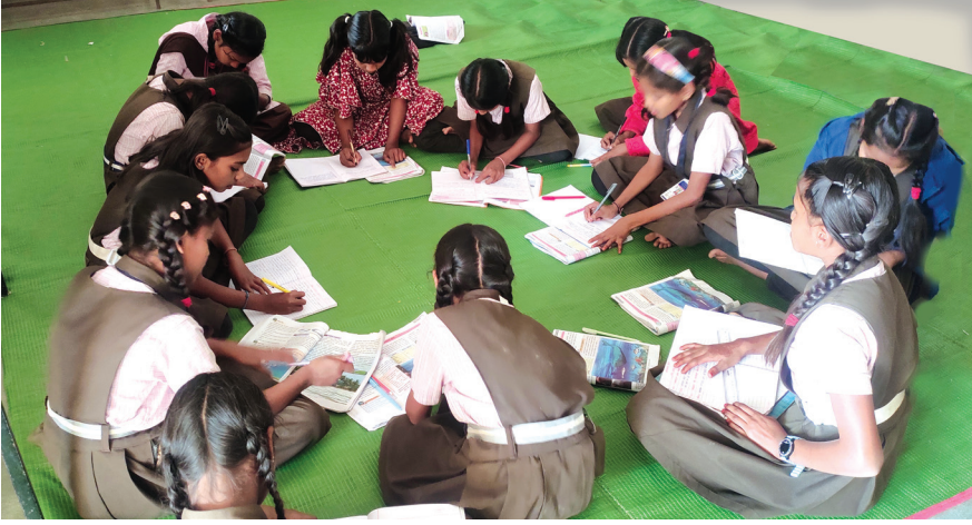
चित्र 4 : ओपन-बुक टेस्ट में शामिल विद्यार्थी

“ औपचारिक साप्ताहिक परीक्षाओं के महत्त्व को कम किया, और आकलन के अलग तरीके अपनाए। इनमें स्व-आकलन, परस्पर-आकलन, समूह कार्य, चर्चाएँ, मौखिक जवाब, आदि शामिल थे। ”