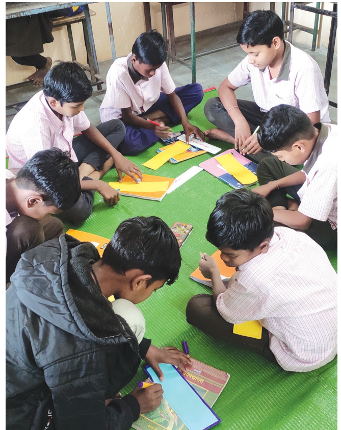
चित्र 3: बाल संसद में विद्यार्थियों ने खुद बनाए कक्षा के नियम

बोर्ड पर 15-20 नियम लिखने के बाद, हम समूहों में एक साथ बैठे और कागज़ की पट्टियों पर ये नियम लिख लिए। फिर उन्हें दीवारों पर चिपका दिया। चूँकि ये नियम विद्यार्थियों ने खुद बनाए थे, इसलिए उन्होंने इनका पालन भी ज़्यादा ईमानदारी से किया। कक्षा अब एक सुरक्षित जगह बन गई जहाँ विद्यार्थी बिना किसी हिचकिचाहट के सवाल पूछने, मदद माँगने और अपनी राय जाहिर करने में खुद को स्वतंत्र महसूस कर रहे थे। सामूहिक फ़ैसला लेने की इस प्रक्रिया ने विद्यार्थियों के साथ मेरे रिश्ते को और मज़बूत किया।