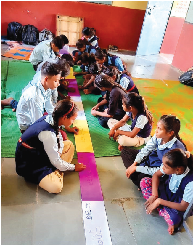
चित्र 1: बीते हुए समय को समय रेखा की मदद से महसूस करना

हालाँकि, यह कहा जा सकता है कि तिथियों और काल (Era) की सटीक समझ होने से इतिहास बोध को विकसित करने में बहुत मदद मिलती है। यह समझ ऐतिहासिक घटनाओं के क्रम को समझने, कालों के अनुसार घटनाओं में अन्तर करने व उनमें सम्बन्ध बनाने तथा समाजों के विकास क्रम की तुलना करने, तर्क करने और विश्लेषण करने में मददगार होती है। संक्षेप में और सरल भाषा में कहा जाए तो इतिहास को समझने से आशय है समय के क्रम के साथ हुए बदलावों को, उनके कारणों और प्रभावों के साथ समझना। समय रेखा या काल रेखा इनको एक कहानी की तरह क्रम से समझने में मदद करती है। ऐतिहासिक घटनाओं के बीच एक बार क्रमिक समझ बनने के बाद इसकी मदद से घटनाओं के कारणों और प्रभावों का विश्लेषण करना आसान हो जाता है। समय रेखा के इस्तेमाल को शिक्षक और विद्यार्थियों के लिए आसान और रोचक कैसे बनाया जा सकता है, इसका अनुभव मुझे मध्य प्रदेश के सागर ज़िले के खुरई ब्लॉक की एकीकृत माध्यमिक शाला बांगची के कक्षा 6 से 8 के