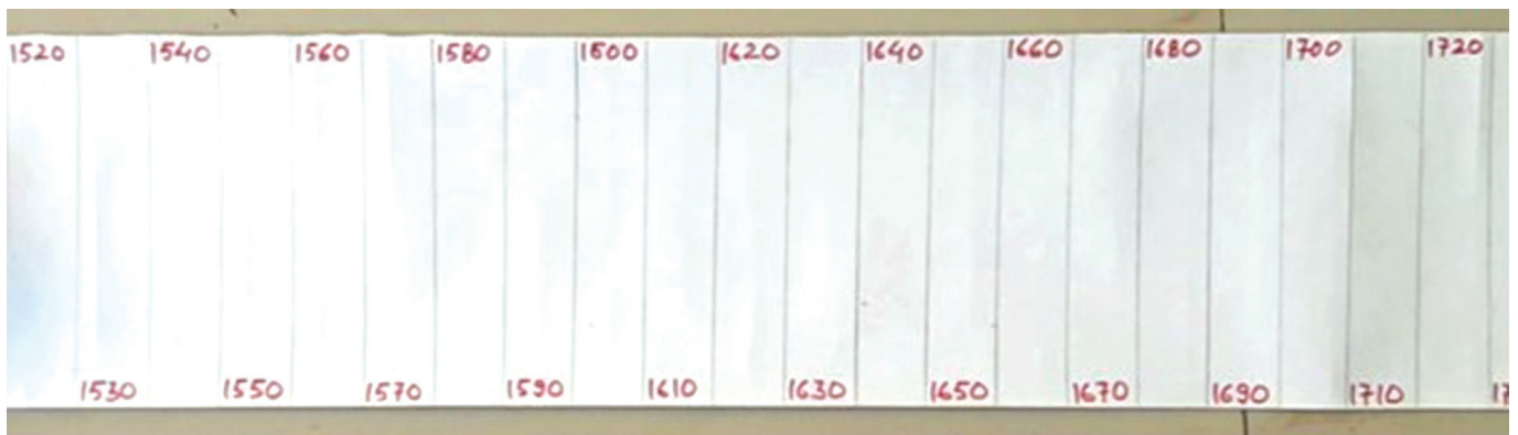
चित्र 3 : महत्वपूर्ण घटनाओं के अंकन के लिए विद्यार्थियों ने बनाई दशकीय समय रेखा

इन सभी गतिविधियों के दौरान ईसा पूर्व और ईसवी की अवधारणाओं की समझ बनाने के लिए भी विद्यार्थियों से बातचीत होती रही। यह बातचीत थी कि आज से 2025 साल पहले एक व्यक्ति हुए थे, जिनको ईसा नाम से जाना जाता है। विद्यार्थियों को ईसा का एक रेखाचित्र दिखाकर बताया गया कि इनके जन्म से आज तक दुनिया भर में सालों को गिना जा रहा है। उनके जन्म के साल को पहला साल मानकर जो साल गिने जा रहे हैं उन्हें ईसवी या सामान्य संवत् कहा जाता है। उनके जन्म के पहले भी हमारी पृथ्वी पर कई घटनाएँ घटी हैं। उन घटनाओं के समय को बताने के लिए उनके समय या सालों को ईसा पूर्व कहा जाता है। ईसा पूर्व के सालों को ही सामान्य संवत् पूर्व भी कहा जाता है। इतिहास पढ़ते समय यह समझना ज़रूरी होता है कि जिस घटना के बारे में बात की जा रही है वह ईसा के जन्म के पहले के समय की है या ईसा के जन्म के बाद के समय की। कक्षा 8 के विद्यार्थी इस बात को अच्छी तरह समझ गए थे। वे बता पा रहे थे कि अभी ईसवी 2025 चल रहा है। भीमबेटका गुफाओं के चित्र, हड़प्पा सभ्यता, जनपद काल, मौर्य साम्राज्य, आदि ईसा के जन्म के पहले के सालों में थे। इसी तरह, खजुराहो के प्राचीन मन्दिर, ताजमहल, राष्ट्रपति भवन, आदि ईसा के जन्म के बाद में बने हैं। समय रेखा पर उपरोक्त