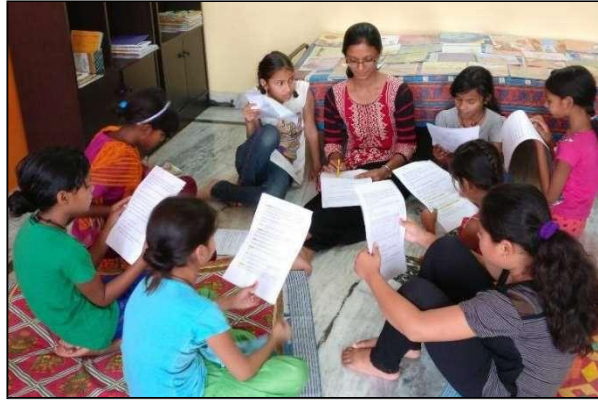
ಚಿತ್ರ 2. ಸ್ಪಷ್ಟನ ವಿವಿಧ ಭಾಗಗಳ ಓದಿನ ನಿರೂಪಣೆಯಲ್ಲಿ ತೊಡಗಿರುವ ಶಿಕ್ಷಕರು ಹಾಗೂ ಅದನ್ನು ಅನುಸರಿಸುತ್ತಿರುವ ಮಕ್ಕಳು.

ಈ ಮಾದರಿಯನ್ನು ಪರಿಚಯಾತ್ಮಕ ಹಂತಕ್ಕೆ ಸೀಮಿತಗೊಳಿಸಬಾರದು. ಒಮ್ಮೆ ವಿದ್ಯಾರ್ಥಿಗಳಿಗೆ ಪಠ್ಯಕ್ಕೆ ಪರಿಚಯವಾಗಲು ಅವಕಾಶ ದೊರೆತ ನಂತರ ಅವರು ತಮಗೆ ದೊರೆತ ಭಾಗಗಳನ್ನು ಓದುವುದನ್ನು ಅಭ್ಯಾಸ ಮಾಡುವಾಗ, ಹಿಮ್ಮಾಹಿತಿಗಳನ್ನು ನೀಡಿ, ಸುಧಾರಿಸಲು ಅವರು ಏನು ಮಾಡಬಹುದೆಂಬುದನ್ನು ನಿರೂಪಿಸಿ.