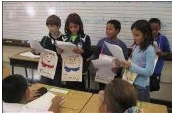
ಚಿತ್ರ 3. ಓದುಗರ ರಂಗಮಂದಿರ 4 ದಲ್ಲಿ, ತಾವು ಮಾಡುತ್ತಿರುವ ಪಾತ್ರಗಳ ಹೆಸರು ಮತ್ತು ಚಿತ್ರವನ್ನೊಳಗೊಂಡ ಲೇಬಲ್‌ಗಳನ್ನು ಬಳಸುತ್ತಿರುವ ವಿದ್ಯಾರ್ಥಿಗಳು